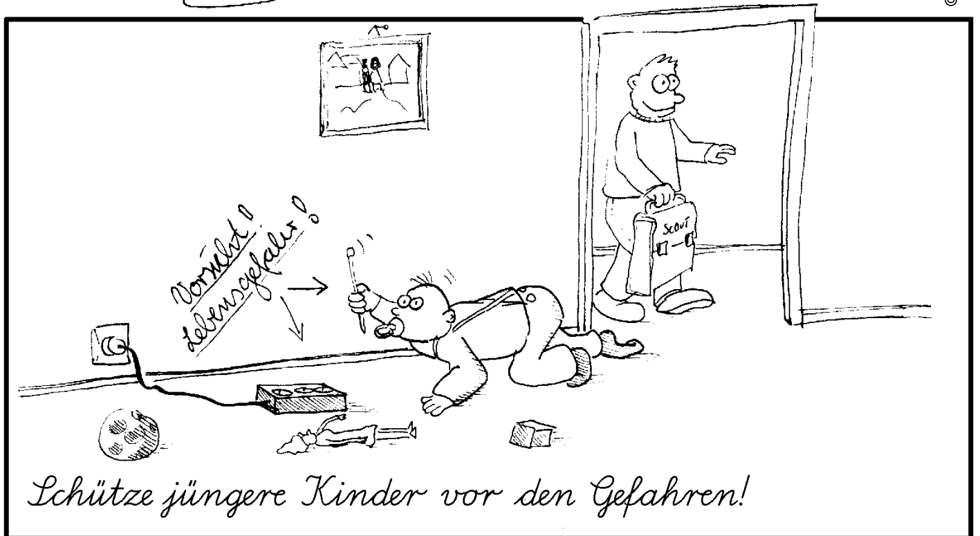
Schütze jüngere Kinder vor den Gefahren!